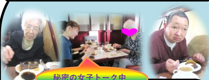
秘密の女子トーク中